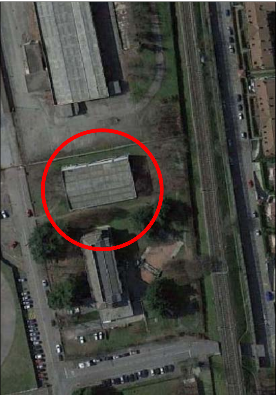
VISTA AEREA DELLA PROPRIETA'